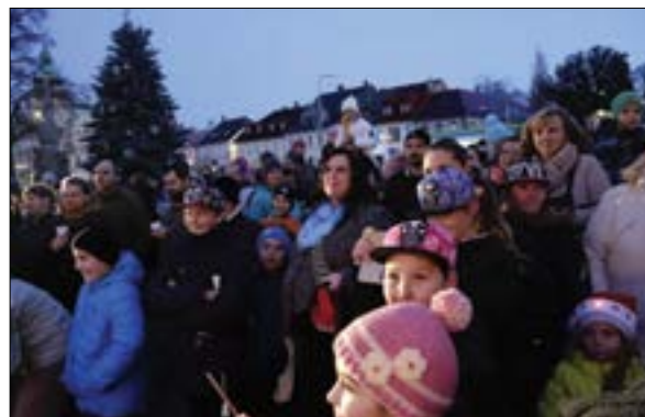
Při slavnostním rozsvěcení městského vánočního stromu vystoupili děti z mateřských škol, žáci a studenti šluknovských škol, mažoretky a Petr Kotvald. Další foto na str. 10.