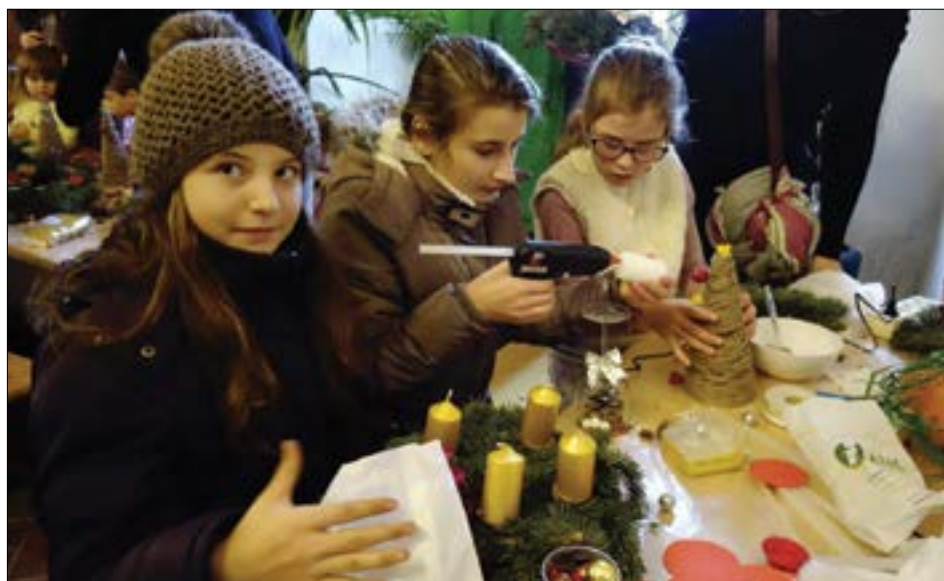
Během první adventní neděle, která byla ve znamení tvorby vánočních věnců, svícňů a dalších dekorací, zavítala do vstupní haly Šluknovského zámku více než stovka návštěvníků.