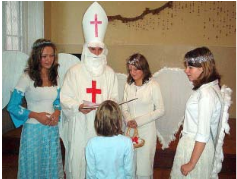
Kolektiv nadpřirozených bytostí z „devítky“ v akci.

... poprosil bych o SIM kartu, šestiložiskový naviják a čtyřmetrový prut. A taky láhev na vodu pro křečka