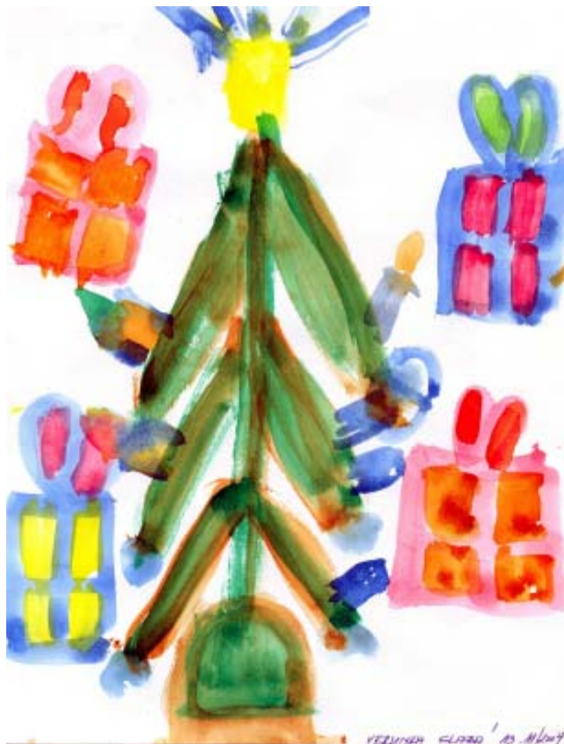
Klienti ÚSP své díky vyjádřili i tímto obrázkem.

Souhlasím, že je škoda zrušit závodistiště. Nemohu však souhlasit s hodnocením fotbalistů, že se na ně vyhazují