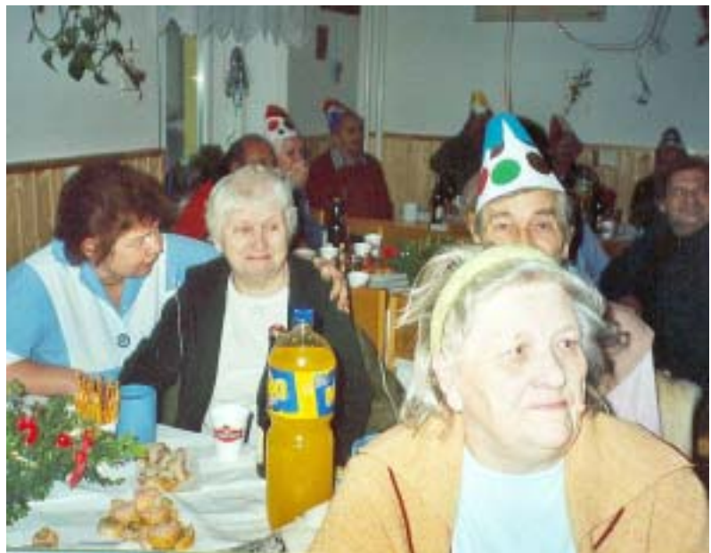
Klienti DD se se starým rokem 2004 rozloučili v klubovně - při muzice a s dobrým jídlem, pitím i náladou.