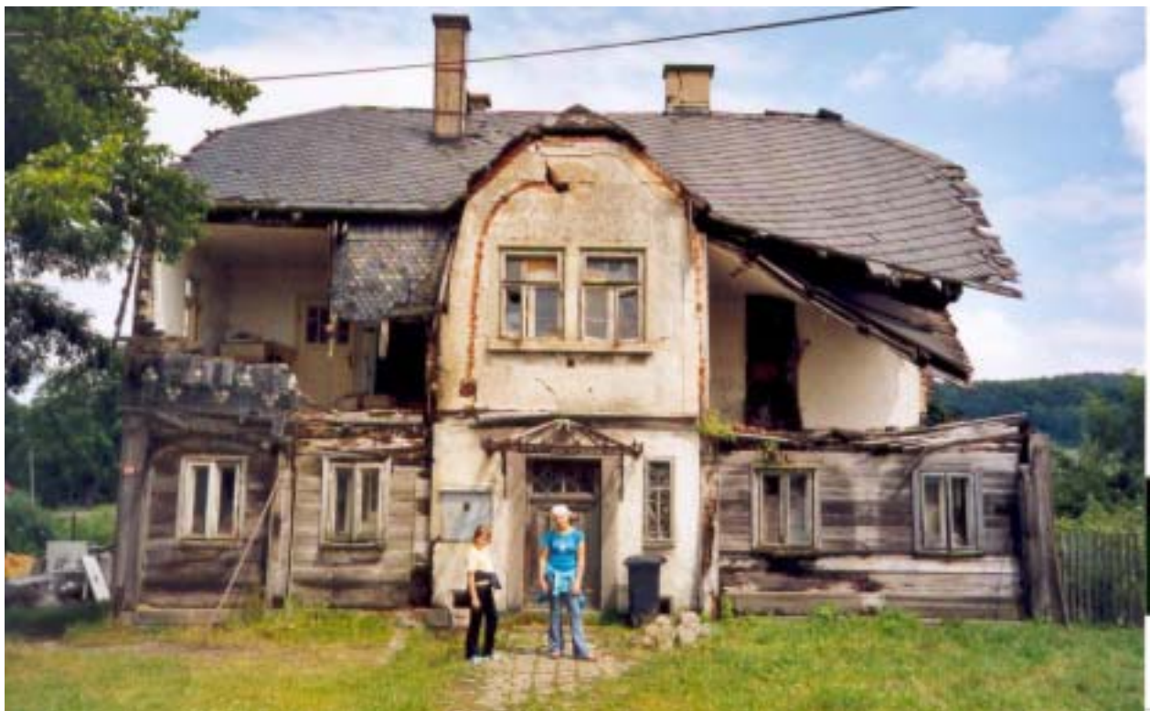
Česko vstupuje do EU - dům v Království č. p. 391 (foceno 6. 7. 2005).