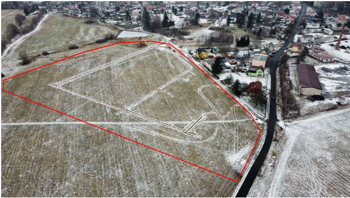
fotografie hotových výkopů pro připojení elektrické energie s vymezením plochy 1. etapy